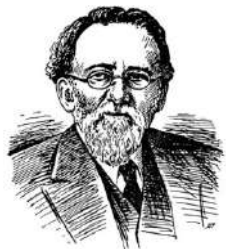
А. Н. Сабанин (1847—1920)