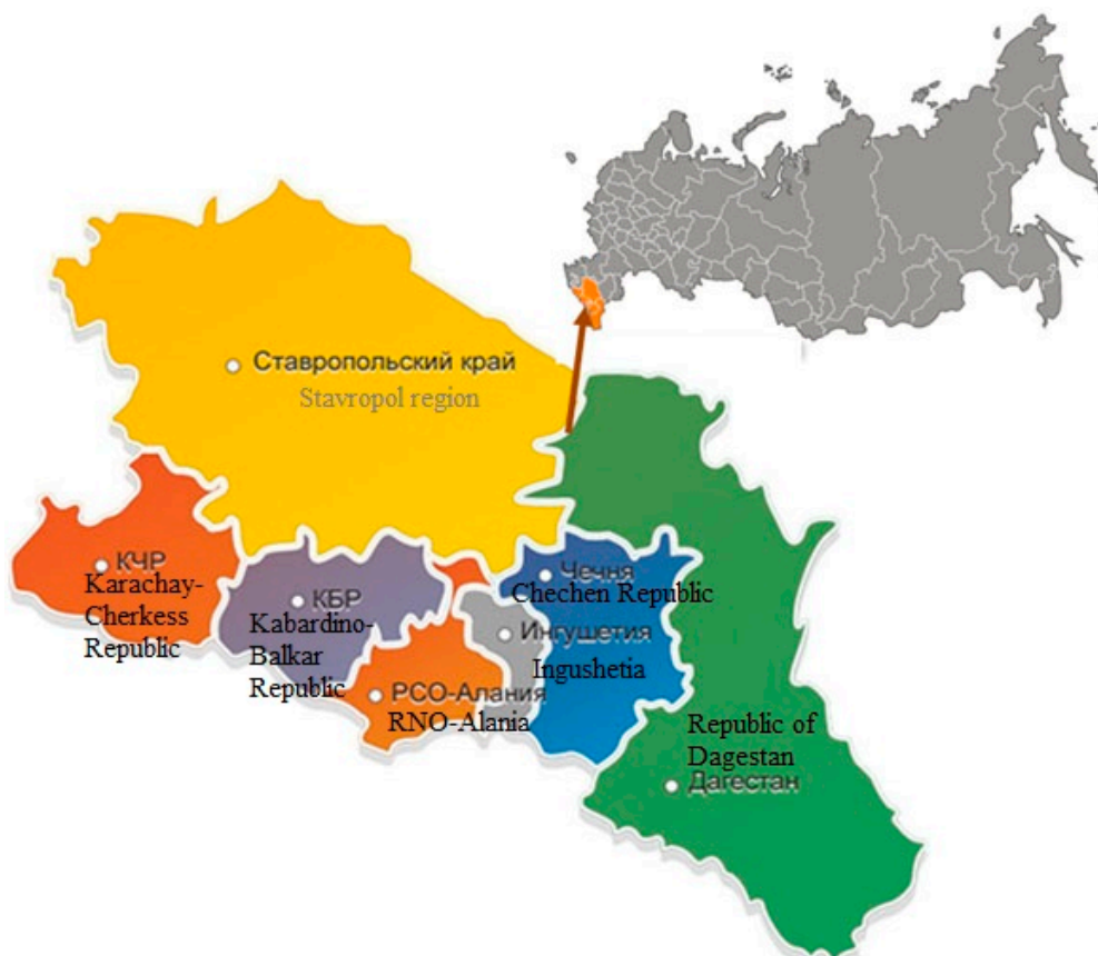
Рис. 1. Территория Северо-Кавказского федерального округа Fig. 1. The territory of the North Caucasian Federal District

Методы исследования. На основе анализа литературных источников и собственных исследований при высокой антропогенной нагрузке на земли сельскохозяйственного назначения и, в первую очередь на сельскохозяйственные угодья выявлены причины, от которых приведшие к такому состоянию. В настоящее время мониторинг земель сельскохозяйственного назначения, как и в других регионах России, проводится устаревшими методиками, которые не учитывают уже прошедшие деградационные процессы, а также и то, что происходит в настоящее время, да и ежегодные локальные